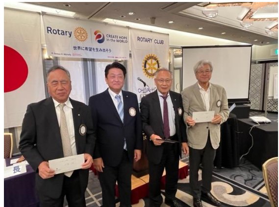
洞倉会員 曾我会員 江上会員 お誕生日おめでとうございます！