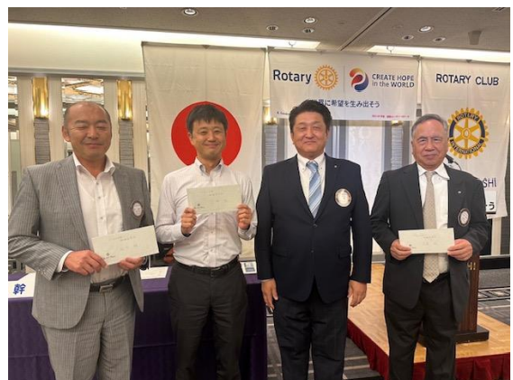
坂下会員 上杉会員 洞倉会員 結婚記念日おめでとうございます！