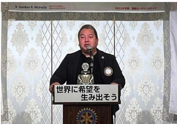
西田会員増強委員長

会員増強イベントは令和 5 年 1 月末まで延長いたしますので、1 月炉辺、2 月例会にビジター見学に注力ください。