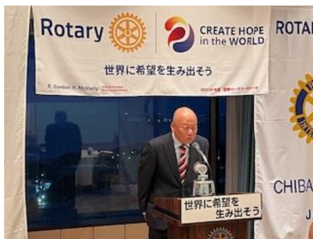
二年間に渡り幹事お疲れさまでした