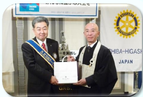
僧侶への御礼はお布施と言うそうです。

人は何時死ぬかも分からないので、未来のことなど当てにならないのです。まずシッカリ終わってから次を始めましょう。そして次が始まったなら、前進あるのみですね。