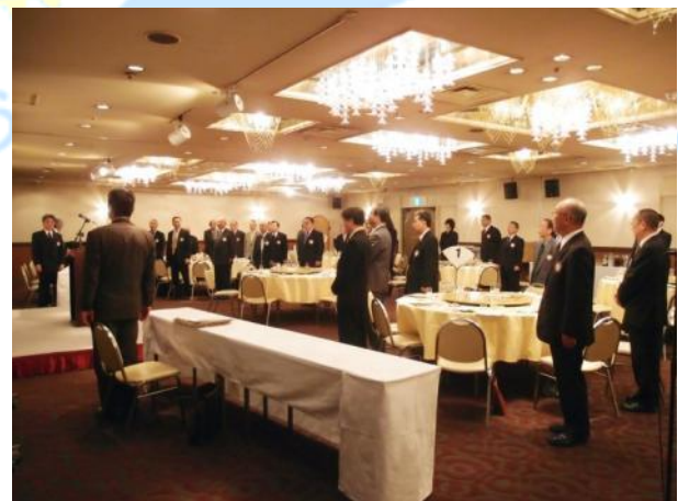
千葉東ロータリークラブ