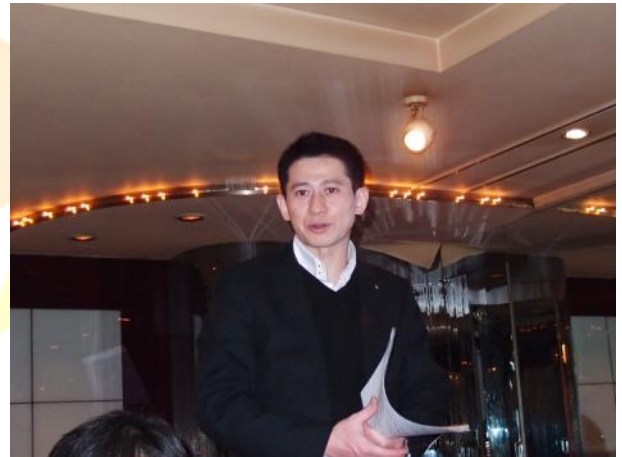
駅前清掃のお礼(千田社会奉仕委員長)