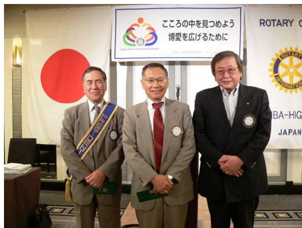
穴倉会長・曾我会員