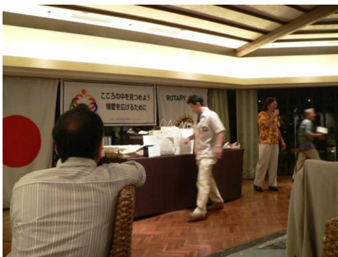
当クラブ名誉会員元五福RCのPRESSと高山AGによる締め