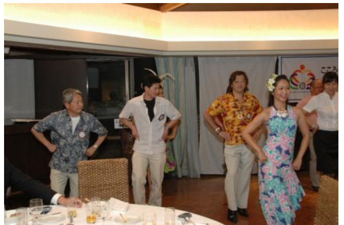
翌日は足腰立たず？