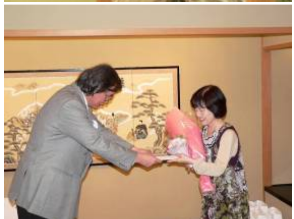
神田会長から花束贈呈