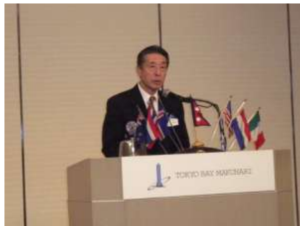
海寶勘一地区クラブ研修委員会委員長