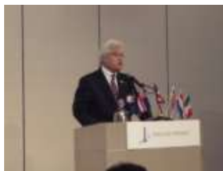
宇佐見第3分区Aガバナー補佐