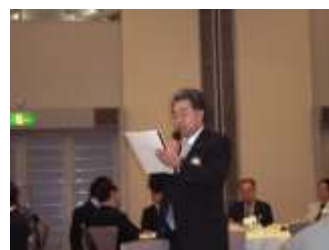
グループディスカッション&発表