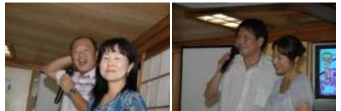
若い人はいいいですね