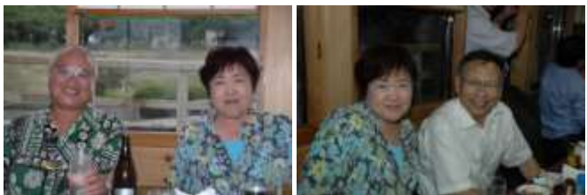
やはり隣は少しでも若い方が