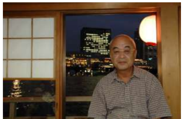
夜のお台場に月二つ