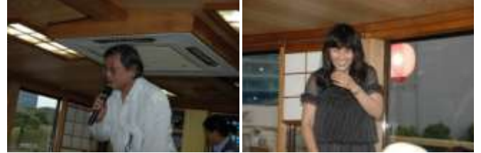
なぜ写真が2枚になるのか？