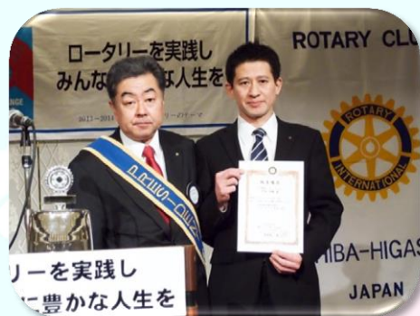
千田会員 青少年奉仕委員会ローターアウト委員